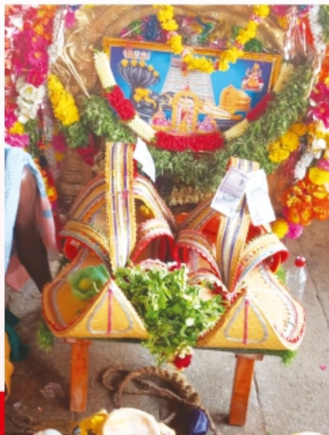
இந்த வருடத்தினுடைய புதிய திருவடி

இந்த படங்களில் உள்ள காலணிகளுக்கு பூ வைத்து உள்ள காரணம் தெரியுமா? ஸ்ரீரங்கத்தில் பள்ளிகொண்டுள்ள பெரிய பெருமாள் அணிந்துகொண்ட பாதுகைகள் தேய்மானத்திற்கு பின் கழட்டி வைக்கப்பட்டு ஸ்ரீரங்கம் திருக்கொட்டாரம் எனும் இடத்தில் தூணில் மாட்டி வைக்கப்படும். அந்த பாதுகைகளுக்கு தான் பூ வைத்து வழிபட்டு வருகிறார்கள்.